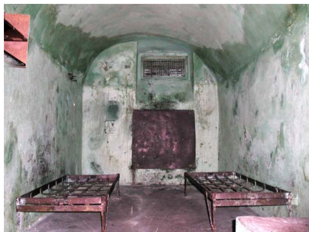
Fotos von Todeszellen, aufgenommen im Jahr 2003