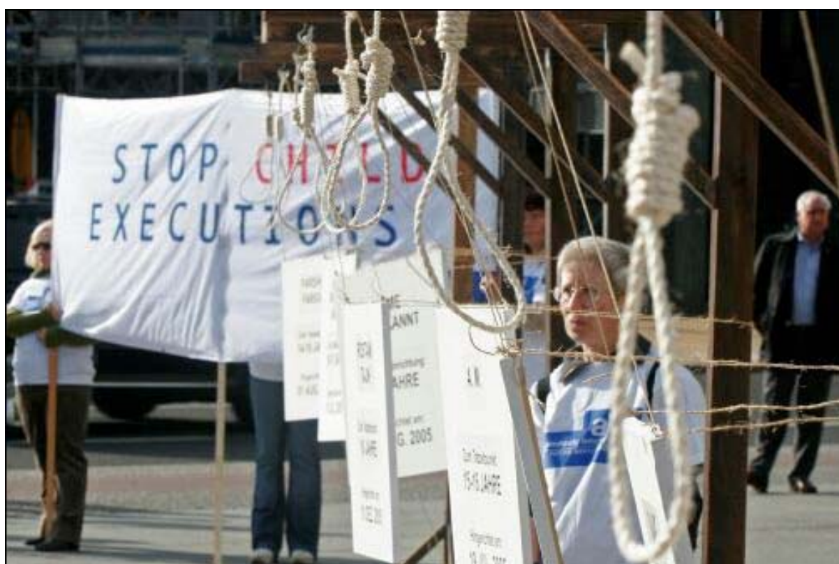
Demonstration von Amnesty International in Berlin am 10. Oktober 2006, dem „Internationalen Tag gegen die Todesstrafe“

Im Dezember 2003 kam die Interamerikanische Menschenrechtskommission zu dem Schluss, dass die USA in beiden Fällen „eine zwingende Norm des allgemeinen Völkerrechts“ verletzt habe, als sie einen Menschen wegen einer Tat hinrichtete, die dieser im Alter von 17 Jahren begangen hatte und dass sie „als Mitgliedsstaat der Organisation Amerikanischer Staaten nicht in Übereinstimmung mit ihren grundlegenden Verpflichtungen zur Achtung der Menschenrechte gehandelt habe“, als sie es zuließ, dass eine Hinrichtung stattfand, „entgegen dem Ersuchen der Kommission,“ einen Aufschub zu gewähren „bis die Verhandlungen vor der Kommission abgeschlossen sind“. Die Kommission empfahl den USA, den nächsten Angehörigen „wirksame Rechtsmittel, einschließlich Schadensersatz“ zu gewähren. 29